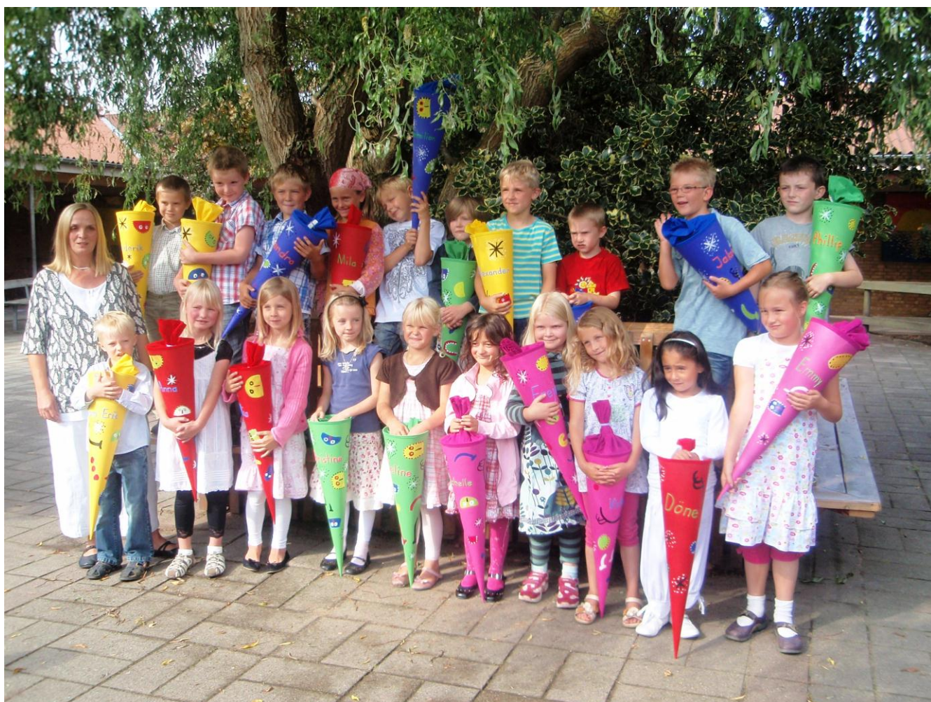
Skolestart i Deutsche Schule Hadersleben med „Schultüte“

Afslutningen af 1. Verdenskrig gav mulighed for en folkeafstemning i 1920. I Nordslesvig stemte 75 % af befolkningen for Danmark, syd for grænsen en tilsvarende andel for Tyskland. Dermed blev den nuværende grænse fastlagt som landegrænse mellem Danmark og Tyskland.