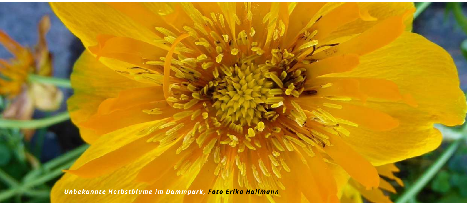
Unbekannte Herbstblume im Dammpark

EIN KULTURMAGAZIN DER DEUTSCHEN MINDERHEIT IN HADERSLEBEN