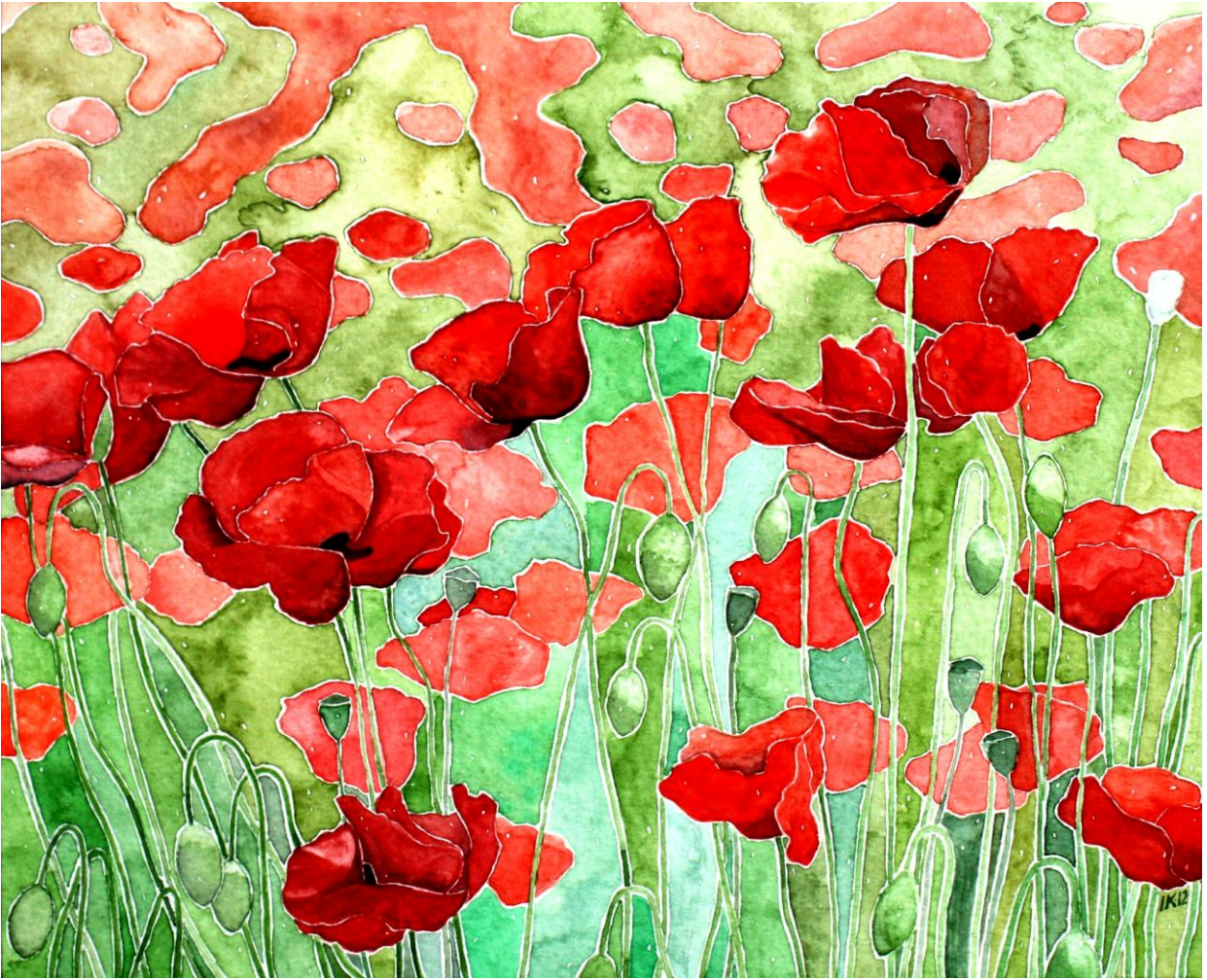
Aquarell: Inge-Lise Kragh